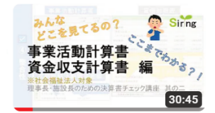
社会福祉法人会計講座 事業 活動計算書・資金収支計算... 8491 回視聴・1年前