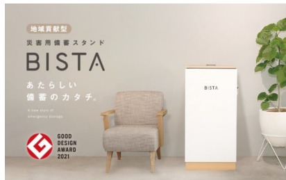
地域貢献型 実用備蓄スタンド BISTA あたらしい 備蓄のカたち。 GOOD DESIGN AWARD 2021