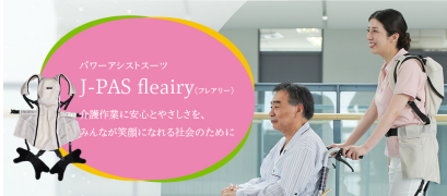
パワーアシストスーツ J-PAS fleairy (フレアリー) 介護作業に安心とやさしさを、 みんなが笑顔になれる社会のために