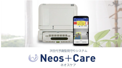
次世代予測型見守りシステム Neos+Care ネオスカア