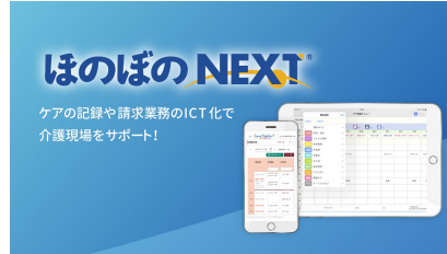
ほのぼのNEXT ケアの記録や請求業務のICT化で 介護現場をサポート!